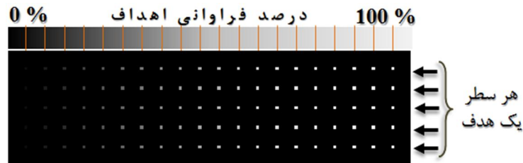
شکل ۲: نمایی شماتیک از نحوه جانمایی اهداف به‌مراه فراوانی هر کدام در فرامکعب شبیه‌سازی شده

نظر حضور دارند. شکل (۲) نمایی شماتیک از چگونگی چیدمان اهداف در این فرامکعب را نمایش می‌دهد.